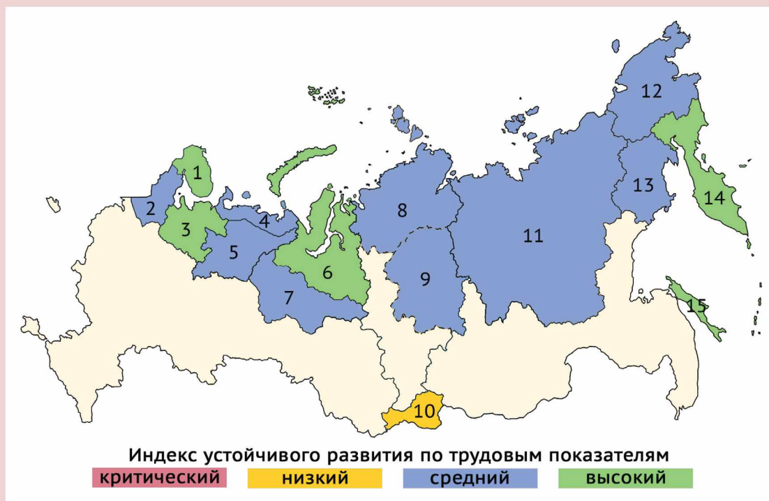
Рис. 1. Карта устойчивого развития Севера России по трудовым показателям, 2015 г.

1 – Мурманская область, 2 – Республика Карелия, 3 – Архангельская область; 4 – Ненецкий АО, 5 – Республика Коми, 6 – Ямало-Ненецкий АО, 7 – Ханты-Мансийский АО, 8 и 9 – Таймырский Долгано-Ненецкий и Эвенкийский районы Красноярского края, 10 – Республика Тыва, 11 – Республика Саха (Якутия), 12 – Чукотский АО, 13 – Магаданская область, 14 – Камчатский край, 15 – Сахалинская область.