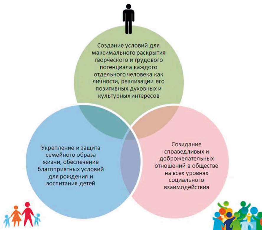
Рисунок 2. В качестве приоритетных направлений политики достижения духовно-нравственного благополучия населения могут быть обозначены следующие:

озабоченность граждан проблемами психологического климата в стране и понимание необходимости положительных преобразований в данной сфере.