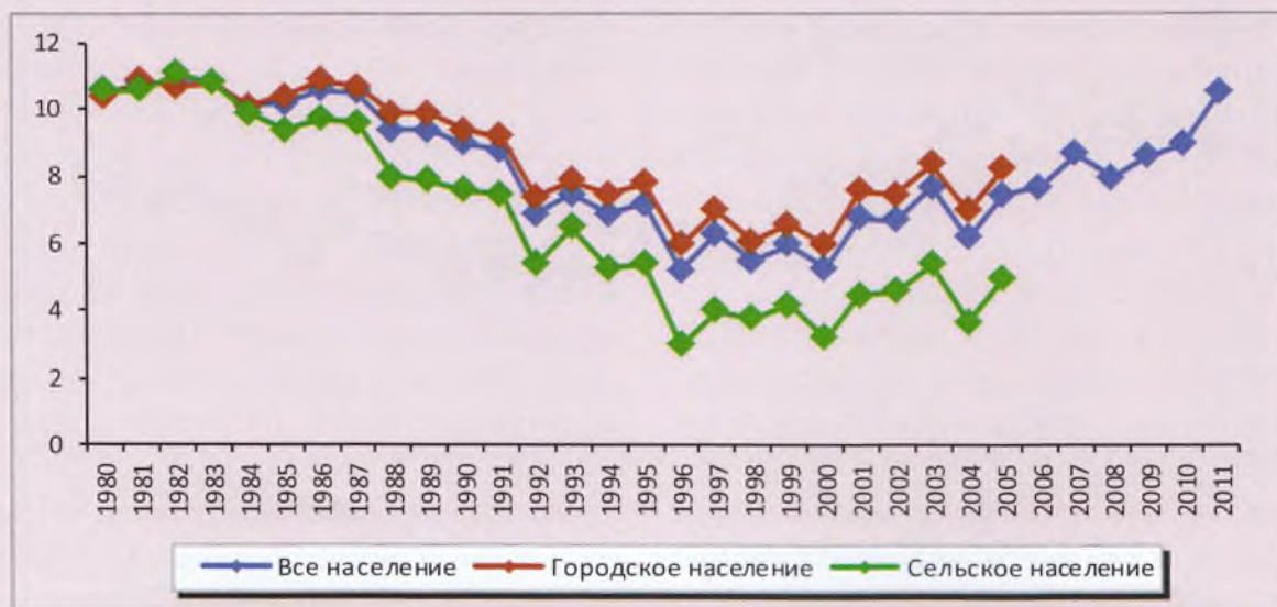
Рисунок 2. Динамика общего коэффициента брачности в Республике Коми в 1980–2011 гг., браков на 1000 человек населения

Демократизация социальных норм, регулирующих взаимоотношения между полами, обусловила постепенный отход от традиционных брачно-семейных норм, вызвав снижение возраста начала половой жизни, широкое распространение добрачных сексуальных отношений, пробных и фактических браков, рост числа браков, стимулированных добрачной беременностью невесты, рост удельного веса внебрачных рождений, происходящих как в факти-