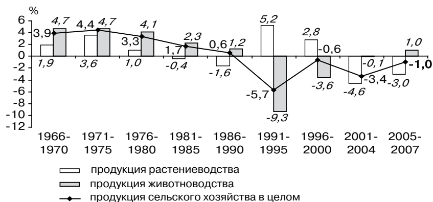
Рисунок 1. Среднегодовые темпы прироста (снижения) продукции сельского хозяйства Республики Коми

Важным качеством инвестиционной системы является ее целостность – способность к воздействию на производственную и рыночную среду. Целостность, отражая единство взаимодействия элементов системы, обеспечивает тесную гармонию между звеньями АПК как единого целого. Такая качественная характеристика представляет собой надежный гарант расширенного воспроизводства и диверсификации капитала более эффективных видов деятельности. В силу этого процесс воспроизводства может обладать высокой динамичностью и эффективностью, а устойчивые субъекты будут мало зависеть от специализированного рынка и внешних источников финансирования. Поэтому при определении деятельности предприятий следует выявить совокупность различных видов ее эффективности (производственной, социальной, экологической, рыночной и т.д.), то есть функциональных форм индивидуального капитала и его кругооборота в целом [3, стр. 164].